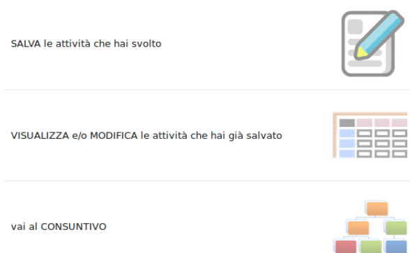
Figura 2: dettaglio della schermata di accesso